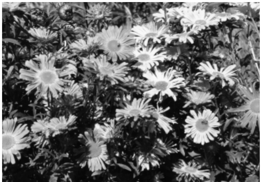
Udaberria: lorak, polena... eta alergiak.

Bukatzeo gogorazi aipatutako neurriez aparte ezinbestekoa dela medikuntzatamendu egokia ondo betetzea. Ondo izan eta hurrengo arte.