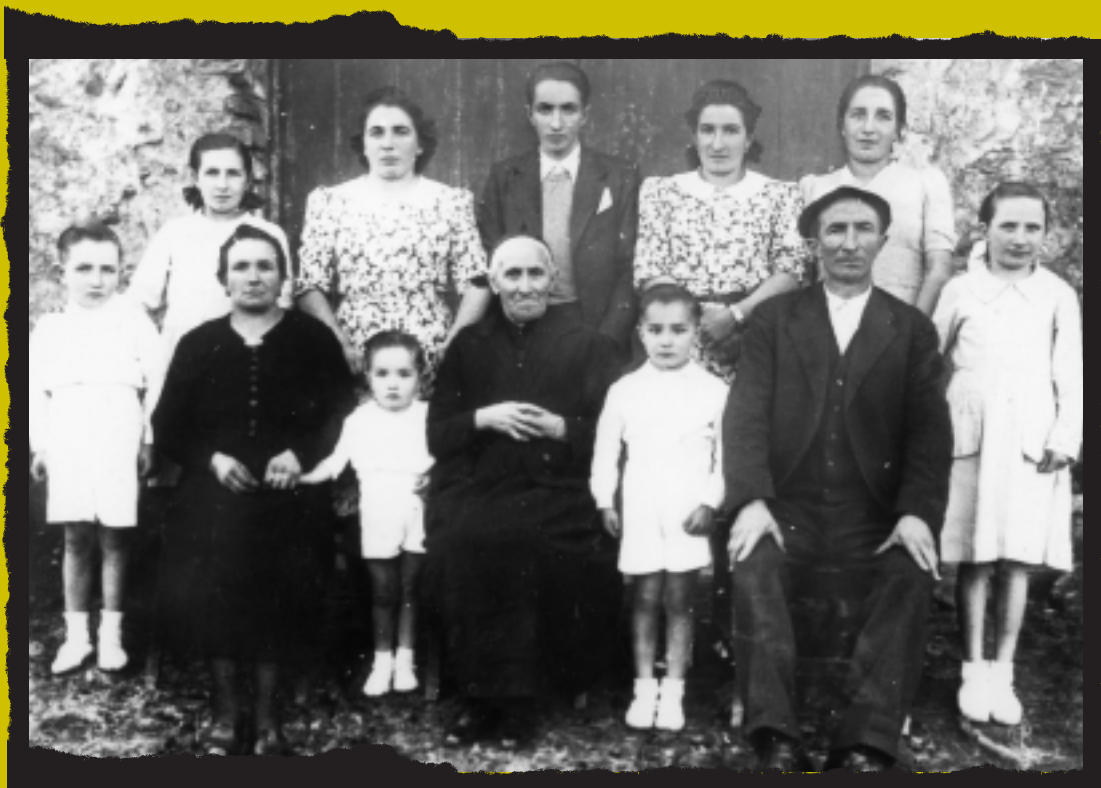
Ezkioko Arteaga baserriko sendia (Korta Okariz)

1940-43 inguruan ateratako argazkia da, Arteagako mandioan, igande-arratsalde batean. Aita- amak dira, seme-alabekin eta amandrearekin.